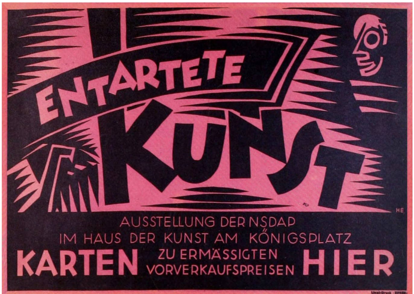
Manifesto della mostra "Arte degenerata", 1938.

Ma ciò che più colpisce nella requisitoria di Loos, facendone una sinistra premonizione, è la supponenza con cui egli si proclama uomo del 1908, relegando gli altri nel 1880 o nel medioevo, distribuendo patenti di ritardatario e di parassita. Il Papua vive nell'età della pietra; il contadino di Kals (Kals am Glossglockner, nel Tirolo orientale) vive nel medioevo; entrambi sono dei pagani; entrambi sono un intralcio per il progresso. Chi non marcia nella stessa direzione e alla stessa velocità pianificate dall'avanguardia politico-economico-culturale è in colpa. «Beato il paese che non ha di questi ritardatari, di questi predoni. Beata l'America!», scrive Loos, memore di aver soggiornato negli USA in gioventù. Ma dimentica che anche l'America ha avuto i suoi ritardatari, i suoi predoni, e ne ha fatto strage e ha rinchiuso i superstiti nei suoi territori più inospitali, le cosiddette "riserve indiane".