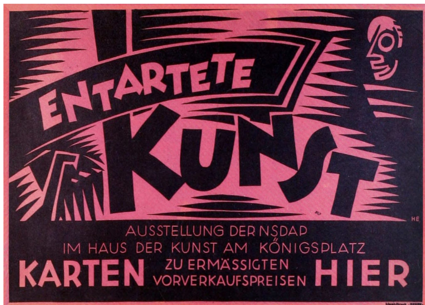
Manifesto della mostra "Arte degenerata", 1938.

Ma ciò che più colpisce nella requisitoria di Loos, facendone una sinistra premonizione, è la supponenza con cui egli si proclama uomo del 1908, relegando gli altri nel 1880 o nel medioevo, distribuendo patenti di ritardatario e di parassita. Il Papua vive nell'età della pietra; il contadino di Kals (Kals am Glossglockner, nel Tirolo orientale) vive nel medioevo; entrambi sono dei pagani; entrambi sono un intralcio per il progresso. Chi non marcia nella stessa direzione e alla stessa velocità pianificate dall'avanguardia politico-economico-culturale è in colpa. «Beato il paese che non ha di questi ritardatari, di questi predoni. Beata l'America!», scrive Loos, memore di aver soggiornato negli USA in gioventù. Ma dimentica che anche l'America ha avuto i suoi ritardatari, i suoi predoni, e ne ha fatto strage e ha rinchiuso i superstiti nei suoi territori più inospitali, le cosiddette "riserve indiane".