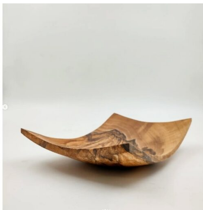
Vittorio Acquati, Svuotatasche rettangolare in noce nazionale fungato , 2022.

In termini di invenzione, in che modo sviluppi i tuoi progetti? Metti a punto il prototipo lavorando direttamente la materia con le macchine utensili, oppure ti avvali anche di elaborati grafici, e in che misura?