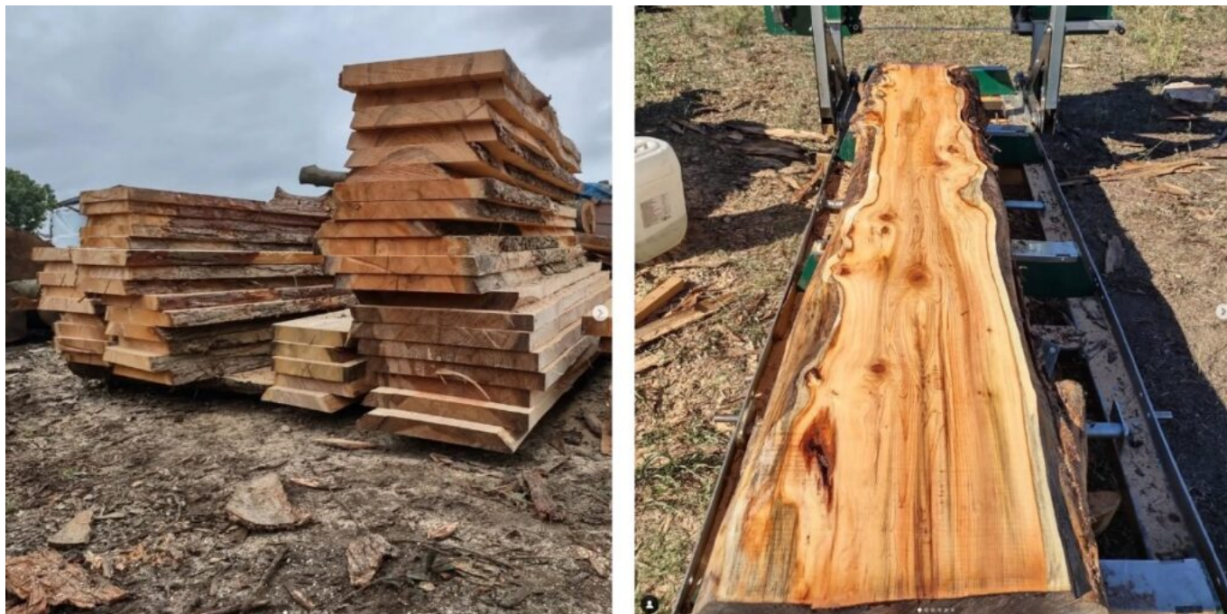
Due momenti di lavoro con la segheria mobile: tavolame di cipresso, cedro e douglasia, 2023; recupero e sezionamento di pianta di tasso proveniente da villa storica in Brianza, 2022.

Osservandoti al lavoro mentre tagli le tavole dai tronchi recuperati, si percepisce come, nella tua ottica, questa fase non sia puramente preliminare, ma abbia già una dimensione qualitativa e progettuale molto chiara. Con quali criteri prepari la materia prima, sia per te sia in conto terzi?