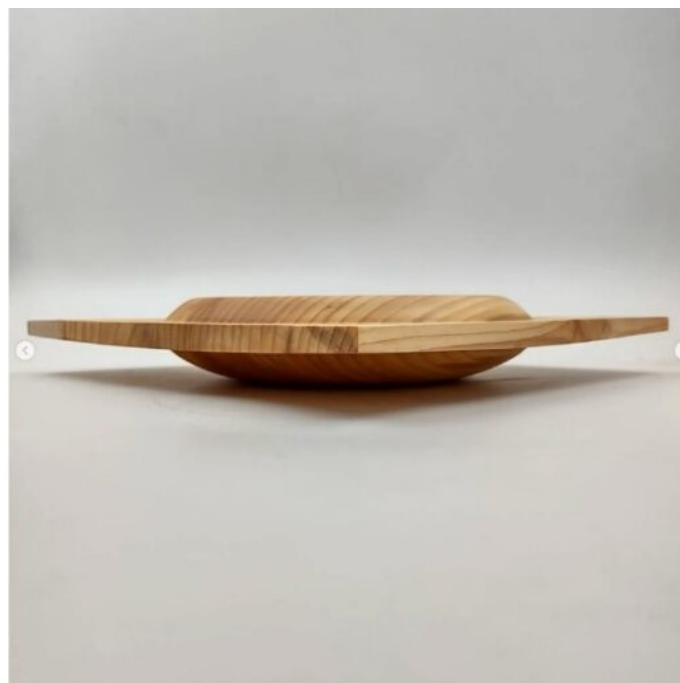
Vittorio Acquati, Svuatatasche in cedro deodara locale, 2022.

Ci sono delle modalità espressive (quanto a materiali, tecnologie, ingombri spaziali o altro) che hai finora tralasciato e che ti piacerebbe poter approfondire in futuro?