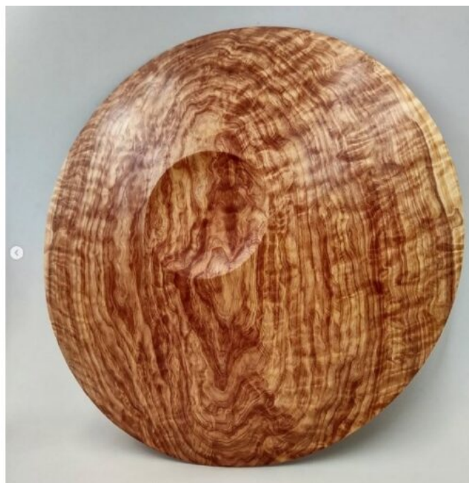
Vittorio Acquati, Centrotavola in cipresso dell'Arizona marezato locale tornito fresco , 2022.

Da parte tua non c'è, almeno in apparenza, uno specifico interesse per gli aspetti ornamentali, in quanto impreziosimento (a intaglio o a intarsio o con altre tecniche) da sovrapporre alla forma primaria dell'oggetto. Tuttavia le trame segniche, le simmetrie e la dialettica dei pieni e dei vuoti dimostrano che sei molto attento anche al decoro degli oggetti, alla loro capacità di dialogare degnamente col contesto circostante. Cosa puoi dire sul tuo rapporto con l'esperienza ornamentale?