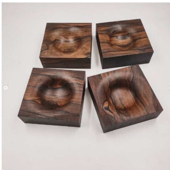
Vittorio Acquati, Svuotatasche in amaranto, afrormosia, ziricote e frassino finiti con tecnica "shou sugi ban", 2023 (photo credits Vittorio Acquati).

Il legno è un materiale fondamentale, che accompagna tutta la storia dell'umanità. Qual è la dimensione artistica, estetica e tecnica che gli attribuisce e che te lo fa preferire a tutti gli altri? Ci sono essenze a te particolarmente care?