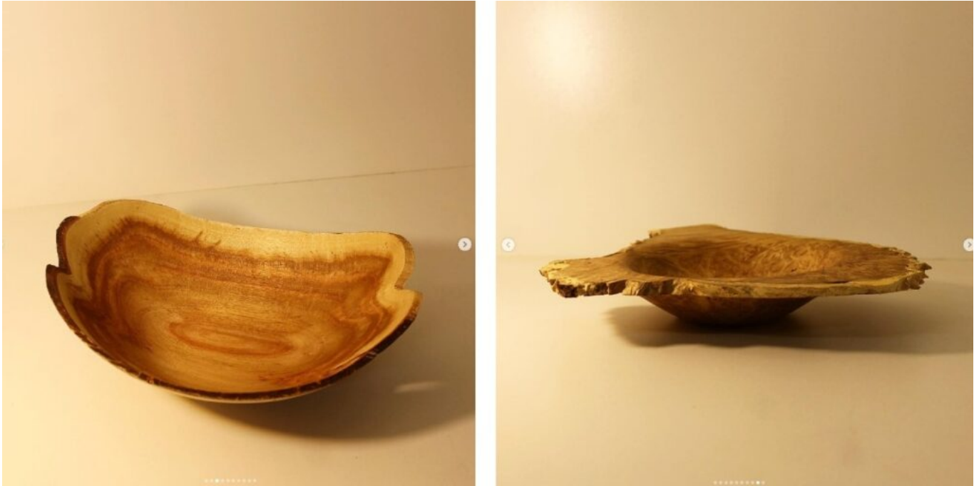
Vittorio Acquati, Due campioni di ciotole live edge prodotte in mimosa, gelso e radica di robinia, tornite fresche e modellate dalle naturali deformazioni del legno, 2021.

oltre che per creare dime e disegni esecutivi.