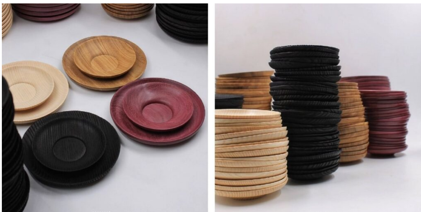
Vittorio Acquati, Piattini in afrormosia, amaranto e frassino finiti con tecnica "shou sugi ban", 2023.

smaltimento, che recupero con il mio progetto di segheria mobile. Sul piano tecnico, il legno rappresenta un buon compromesso in termini di lavorabilità rispetto a materiali più duri, come i metalli o la pietra. Inoltre, esso risulta lavorabile in una forma finita senza ulteriori processi quali la cottura, come nel caso dell'argilla e del vetro. Inoltre, col legno è possibile realizzare una varietà di oggetti che pochi altri materiali consentono di produrre. Sotto il profilo artistico-estetico, il legno offre una quantità infinita di texturizzazioni e lavorazioni superficiali che, abbinare o utilizzate singolarmente, consentono di ottenere i più disparati effetti cromatici e tattili. Le essenze con cui preferisco lavorare sono generalmente quelle classiche europee, sia latifoglie che conifere, che, rispetto a molte specie esotiche, offrono una lavorabilità ottimale. La specie che forse mi è più cara è il cedro del libano, una delle piante più diffuse, nelle sue diverse varianti, come albero ornamentale in Lombardia. Esso è un esempio evidente del valore che gli alberi urbani possono avere nella produzione di legname da opera.