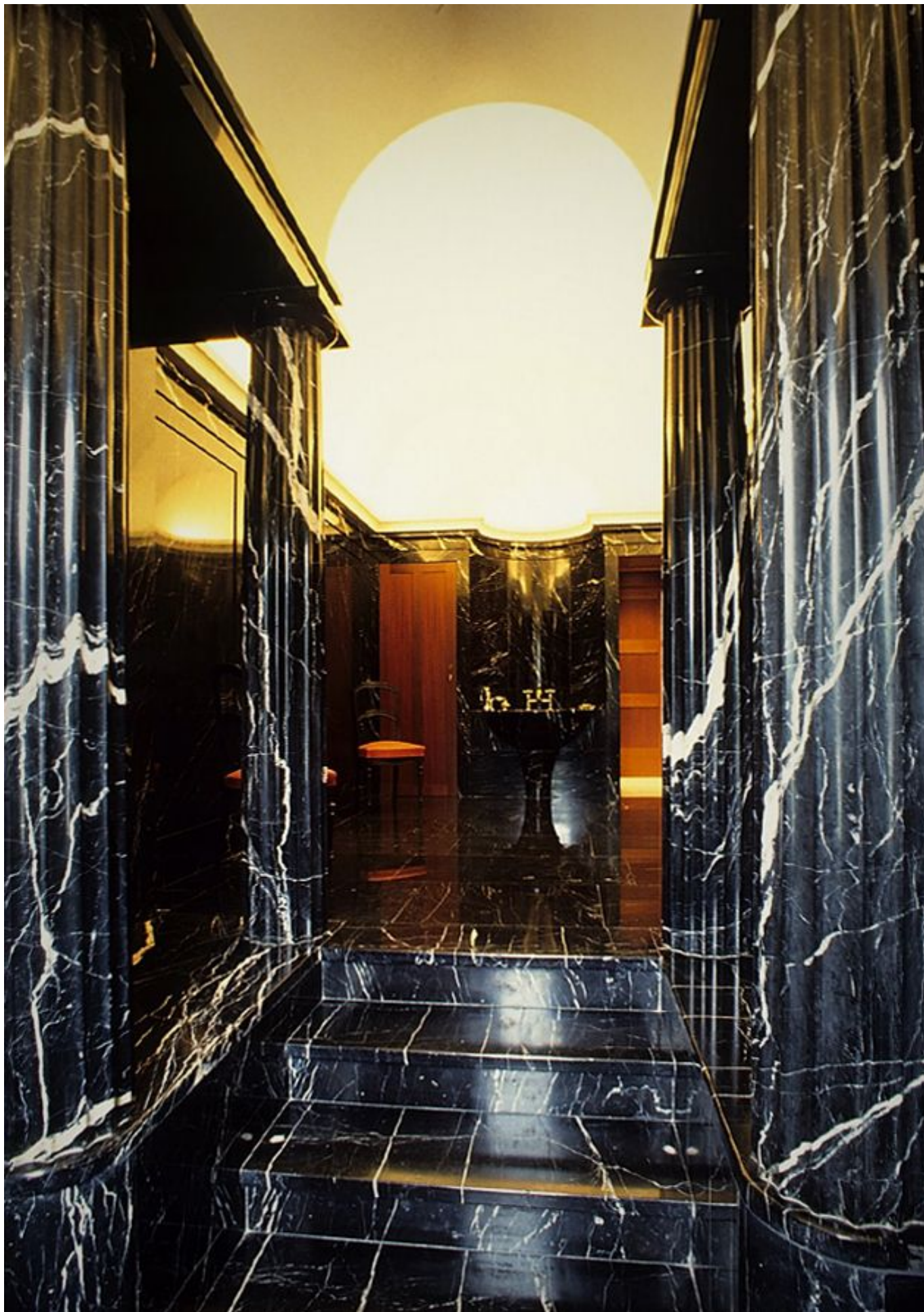
Adolf Loos, Villa Karma (particolare dei rivestimenti marmorei), 1903-06, Montreux.