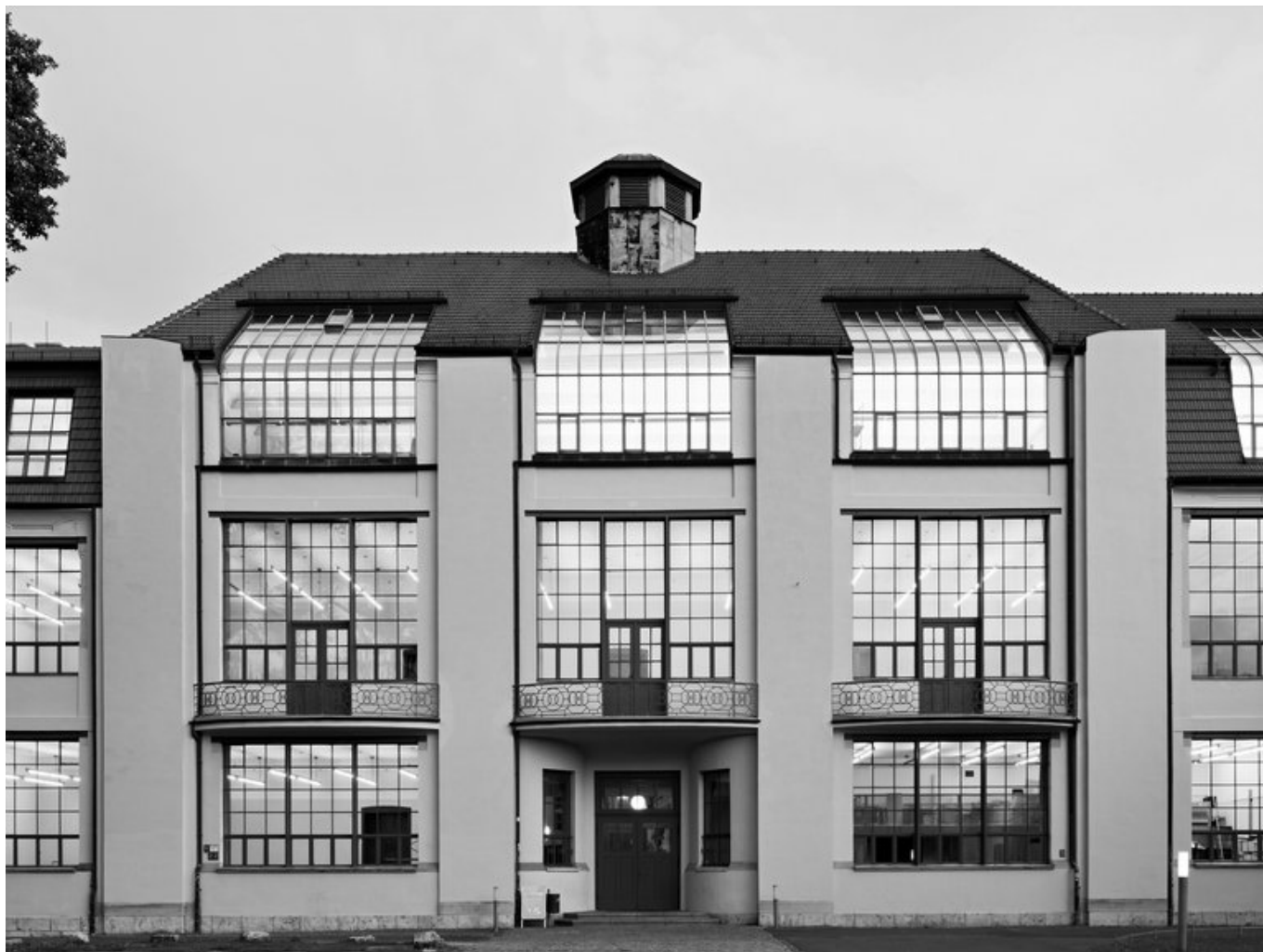
Henry Van de Velde, Edificio della Scuola di Arti Applicate (poi Bauhaus), 1904-11, Weimar.

Accanto a questa tensione verso la razionalità, non del tutto confermata nella pratica a dire il vero, troviamo nei suoi scritti puntuali riferimenti alla fascinazione macchinista e al culto della bellezza ingegneristica che incontreremo vent'anni dopo nella rivista "L'Esprit nouveau" di Jeanneret (Le Corbusier) e Ozenfant. Così scrive Van de Velde nel 1897: «E l'essenziale fulcro di questo nuovo stile deve essere, a mio giudizio, quello di non creare nulla che sia privo di un fondamento pratico e razionale, con il ricorso anche all'aiuto dell'onnipotente strumento della grande industria con il suo formidabile macchinario e le sue svariate conseguenze» [14]. Oppure: «L'anima di ciò che questi uomini [gli ingegneri] creano è la ragione, il loro mezzo il calcolo; e il frutto di questa cooperazione della ragione e del calcolo sarà la più certa e più pura bellezza!» [15]. Peraltro, il Bauhaus , uno dei principali centri di sperimentazione e diffusione del credo funzionalista in Europa, è la diretta conseguenza della pratica pedagogica di Van de Velde che, lasciando Weimar allo scoppio della grande guerra, indica nel giovane Gropius il suo ideale successore. Ma è proprio dal punto di vista della sua teoria della forma ornamentale astratta che possiamo trovare un legame implicito con il linguaggio architettonico funzionalista. Soprattutto