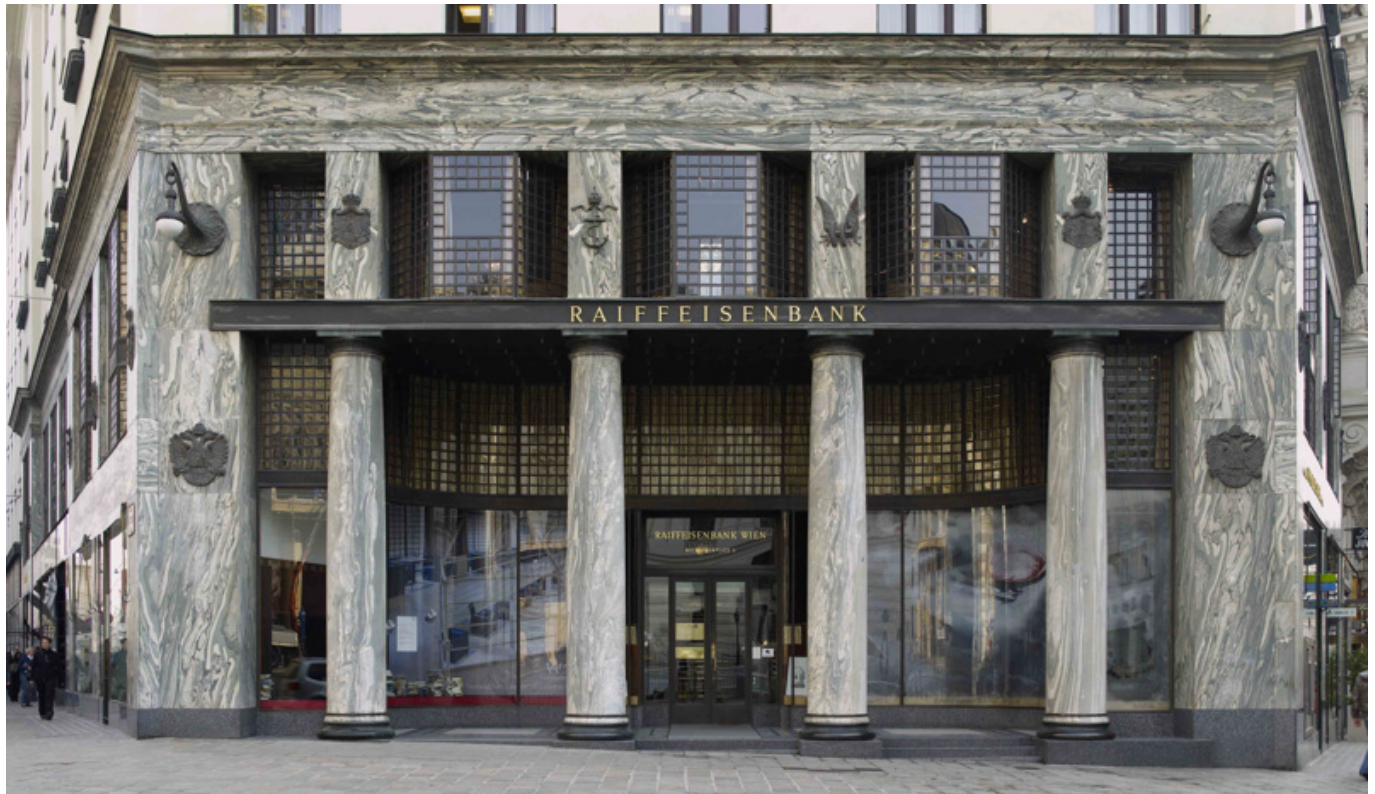
Adolf Loos, Casa sulla Michaelerplatz o "Looshaus" (particolare del prospetto), 1909-11, Vienna.

Invece, per entrambi, bisognerebbe chiedersi innanzitutto: che tipo di ornamento? Sarebbe sufficiente ricordare che Loos si laureò in Architettura a Dresda, nell'università dove ancora era forte l'impronta culturale di Gottfried Semper, e che il suo riferimento costante fu Karl Friedrich Schinkel, il più grande architetto neoclassico tedesco, per mettere in discussione il paradigma del pioniere che indica la strada della liberazione dal giogo ornamentale verso il nascente funzionalismo. O, più semplicemente, basta osservare le sue architetture. Il celebre edificio nella Michaelerplatz di Vienna, conosciuto oggi come Looshaus , che tanto scandalizzò i suoi contemporanei, ha il portico scandito da quattro colonne doriche. Non solo, queste quattro colonne non hanno alcuna funzione statica, tanto da essere state l'ultimo elemento inserito nella facciata: non tettonica quindi ma consapevole scelta ornamentale, ben al di là dell'uso di un ordine classico.