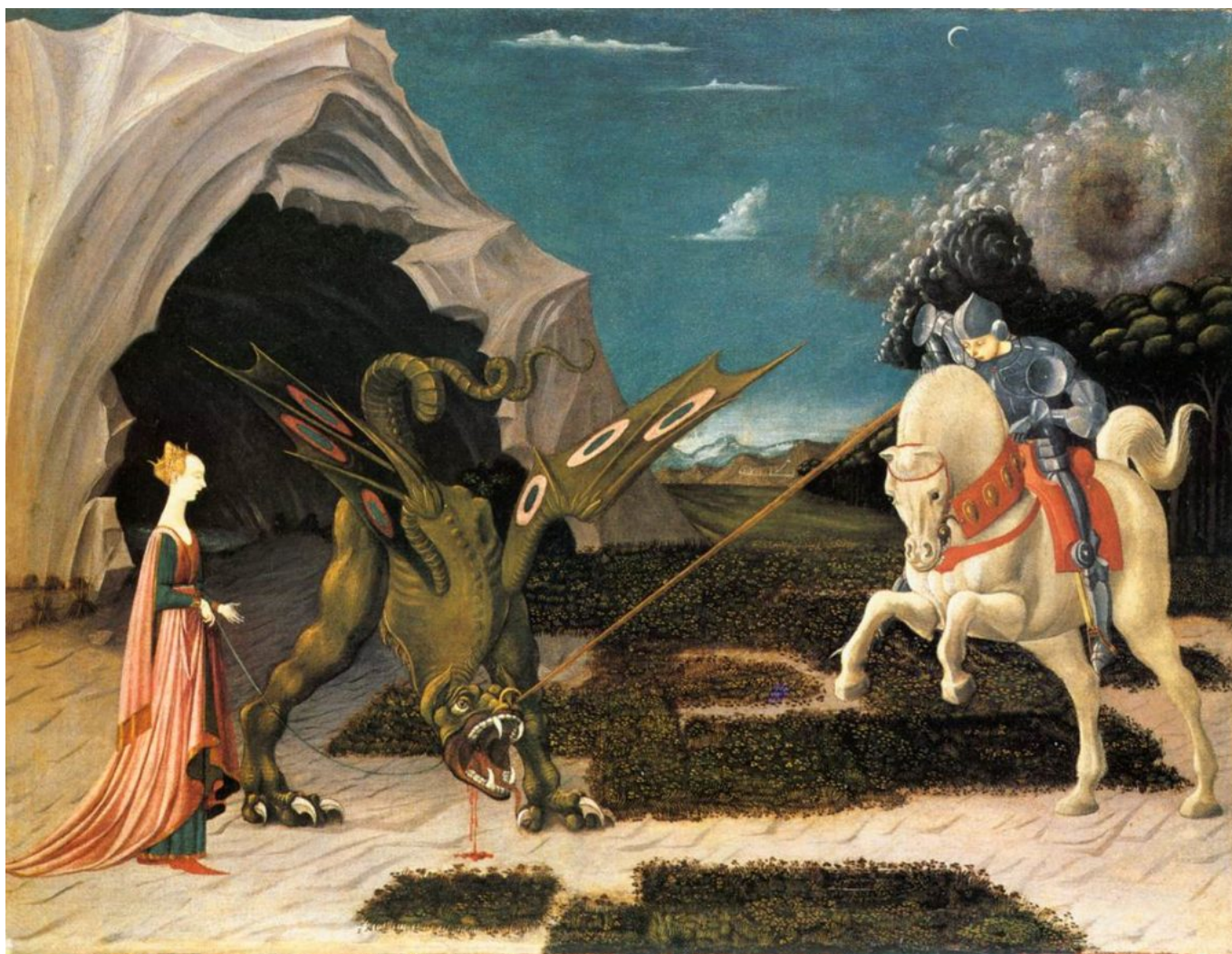
Paolo Uccello, San Giorgio e il drago, 1456 circa, olio su tela, cm. 57 x 73, Londra, National Gallery.

San Giuseppe, durante il Medioevo, passa per grullo o ubriaco, porta brache a righe. Mentre il punteggiato è divino e il maculato viceversa satanico, la rigatura sarà la mediazione. Memling, Bosch, Bruegel collocano al centro del quadro spesso un personaggio vestito a righe: lo sguardo ne è attratto e quindi se ne distoglie. È avviato a circolare per la composizione.